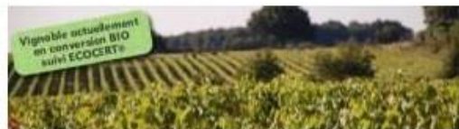
Le Clos Des Sables