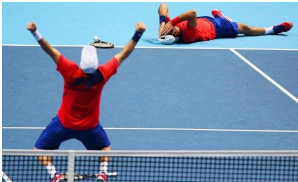
En Pré-National, l'équipe 1 de Paluel n'a pas été loin de créer l'exploit, mais c'est finalement Evreux qui s'en est sorti.