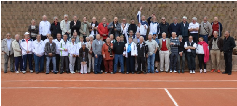
La grande photo de famille des Challenges 125 et 130 au Country Club du Havre TC