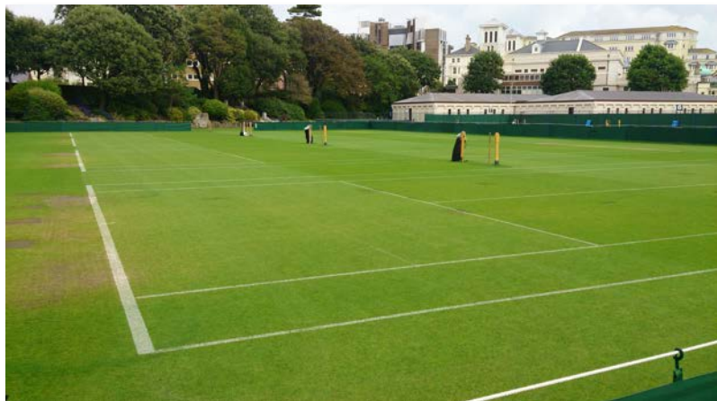
Après quatre jours de report, l'organisation a finalement décidé d'annuler le tournoi