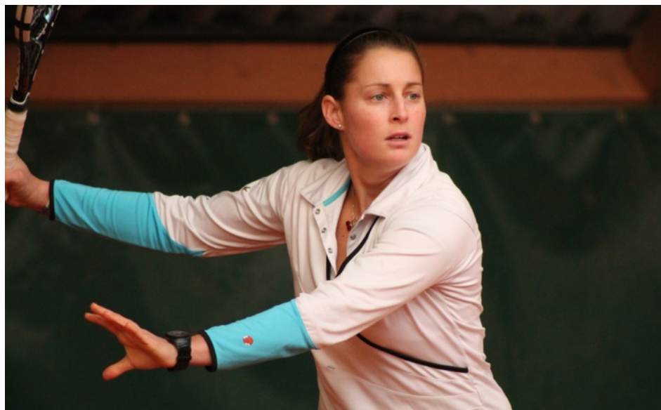
Paralysée par l'enjeu au premier set, l'espagnole a pourtant fini par hausser son niveau de jeu et s'en sortir